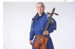
モンゴル〜バートルジャブ