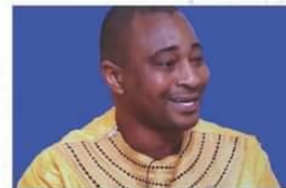
コートジボワール〜サコ