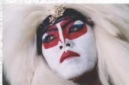
カブキロックス 氏神一番