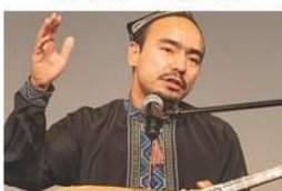
ウイグル〜ディリヤアル