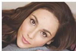
イタリアーダニエラ