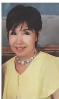
roco producer personality