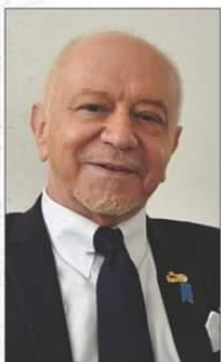
駐日サンマリノ共和国特命全権大使 駐日外交団長