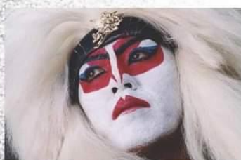
KABUKI ROCKS UJIGAMI ICHIBAN